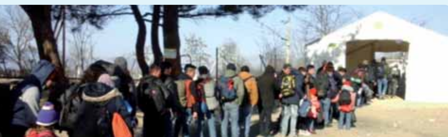
Misiunea CESE în Grecia – Centrul de primire pentru situații de urgență din Eidomeni

Rezultatul votului: adoptat cu 152 de voturi pentru, 6 voturi împotriva și 13 abțineri